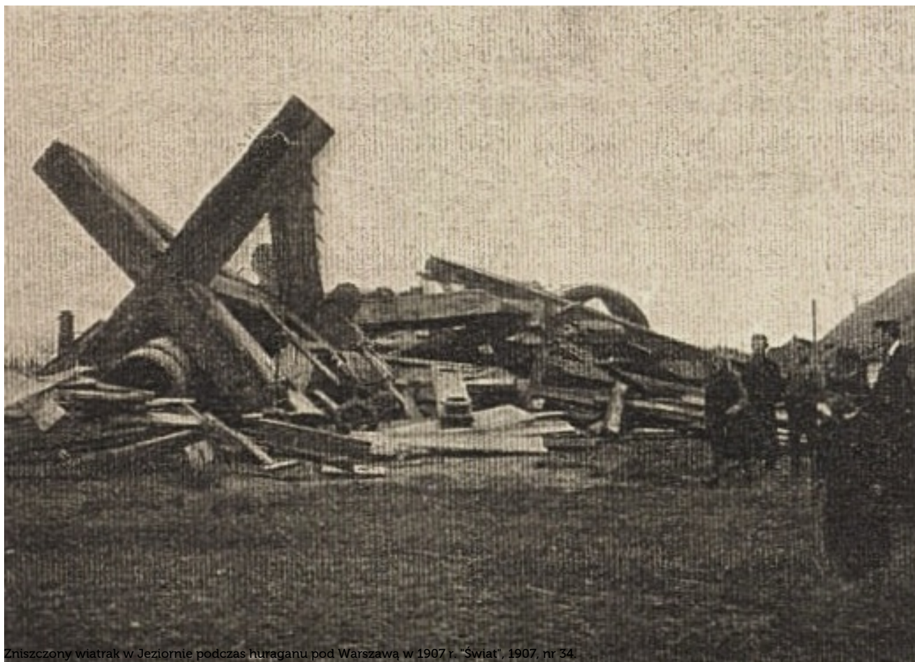
Zniszczony wiatrak w Jeziornie podczas huraganu pod Warszawą w 1907 r. "Świat", 1907, nr 34.

W roku 1907 przez wieś przeszedł huragan, niszcząc istniejący tu od stu lat wiatrak. I Wojnę Światową miejscowość przetrwała w stanie nienaruszonym, choć na terenie gminy toczyły się walki prusko-rosyjskie. W roku 1921 w Jeziornie Królewskiej zamieszkiwało 824 ludzi, wśród których odnotowano 137 Żydów, nie mniej liczny był obszar przylegający do wsi, położony wzdłuż ulicy Fabrycznej, zwany Konstancinkiem, stanowiący dzielnicę biedoty, zamieszkiwany przez 1455 mieszkańców, spośród których 399 było żydowskiego pochodzenia. Nic więc dziwnego, że siedzibą judaistycznej gminy wyznaniowej obejmującej również Piaseczno i Wilanów stała się właśnie Jeziorna Królewska.