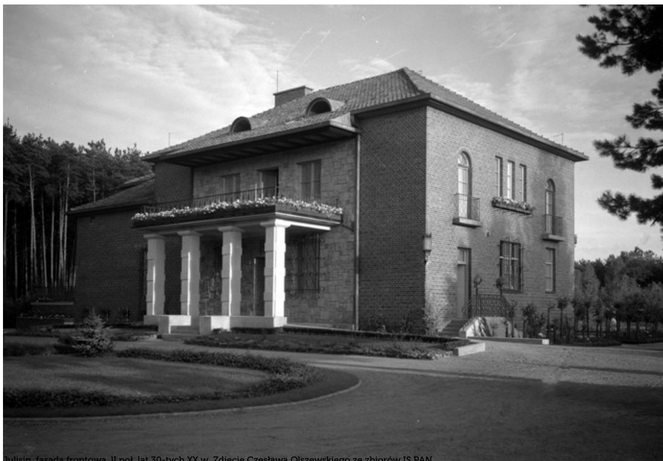
Julisin, fasada frontowa, II poł. lat 30-tych XX w.