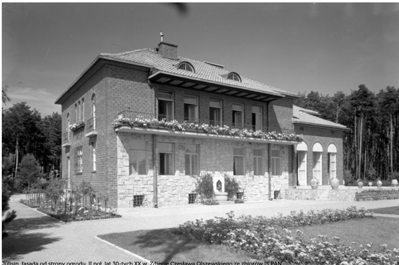
Julisin, fasada od strony ogrodu, II poł. lat 30-tych XX w.