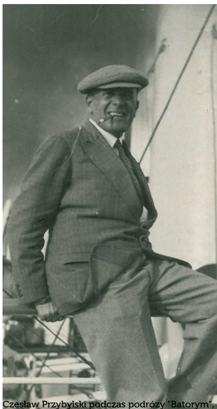
Czesław Przybylski podczas podróży "Batorym", 1930 r.

„Pisać o Przybylskim jest to pisać historię przełomu w architekturze polskiej. (...) Rok 1900 olbrzymi ruch budowlany... o architekturze nawet się nie mówi – najwyżej o stylach. W tej epoce fermentu dojrzał Przybylski. Przybylski nie był człowiekiem rewolucji, był człowiekiem ładu. Umiar i poczucie harmonii były Jego cechą najistotniejszą zarówno w twórczości, jak i w życiu. Budowle zaprojektowane przez Przybylskiego mają własną witalność. Mogą przeżyć zmianę przeznaczenia, niejeden przewrót społeczny, a zawsze będą dobre i odpowiedzą celowi. Jego teatry - Polski, Kaliski, Wileński, Narodowy stworzyły epokę w pojmowaniu prostoty i elegancji wnętrza. Szereg projektów gmachów publicznych, muzeów, ministerstw, sądów niestety w większej części nie zrealizowane, ale zwycięskie w konkursach. Pokazał jak należy projektować – jasno, prosto i z rozmachem”.