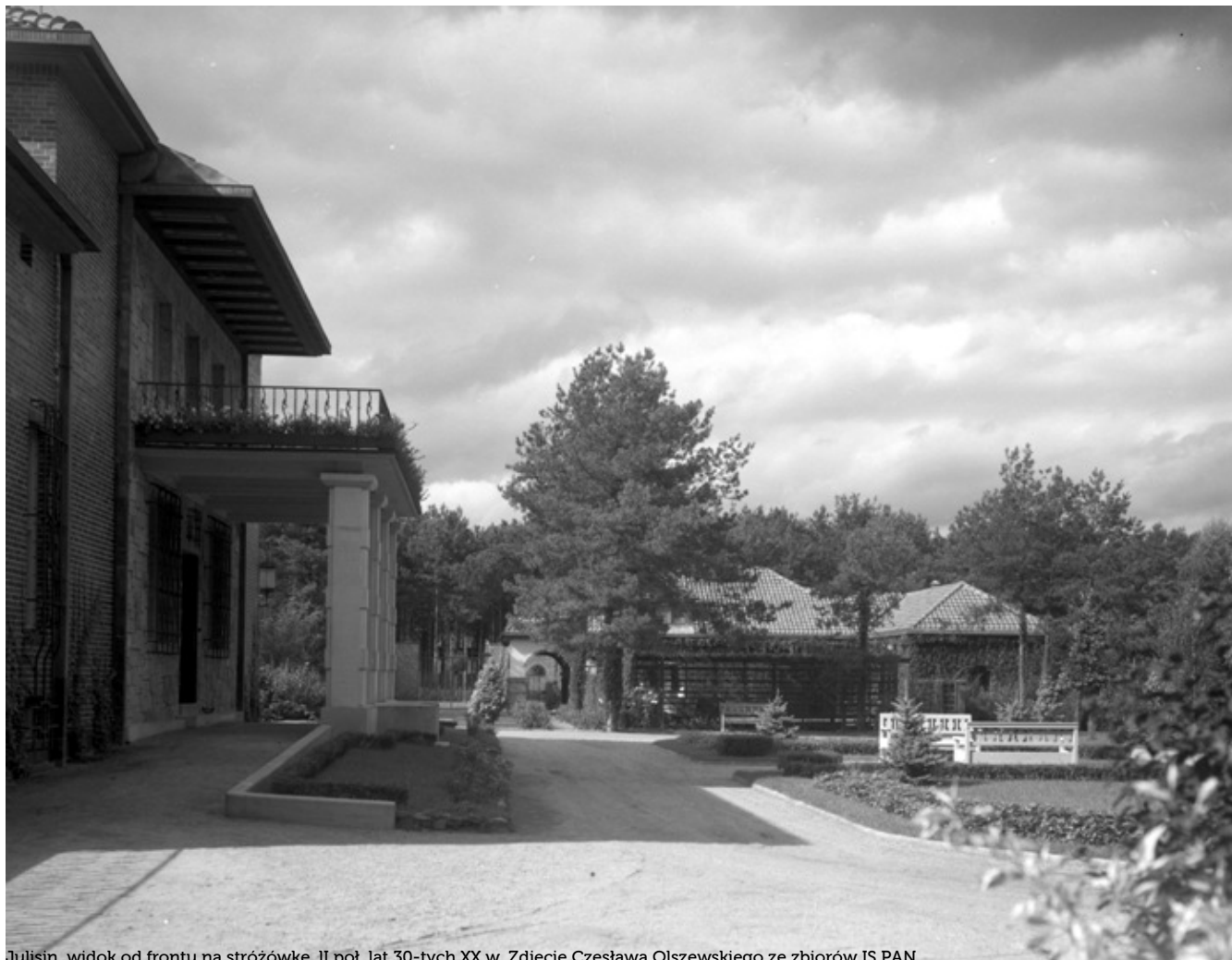
Julisin, widok od frontu na stróżówkę, II poł. lat 30-tych XX w.

Projekt powstał w latach 1933-35. Dom ten zaprojektowany wraz z domem służbowym i ogrodem zbudowany został z cegły i szarego kamienia, z kratami z kutego żelaza, określane jako jedno z najbardziej udanych jego dzieł.